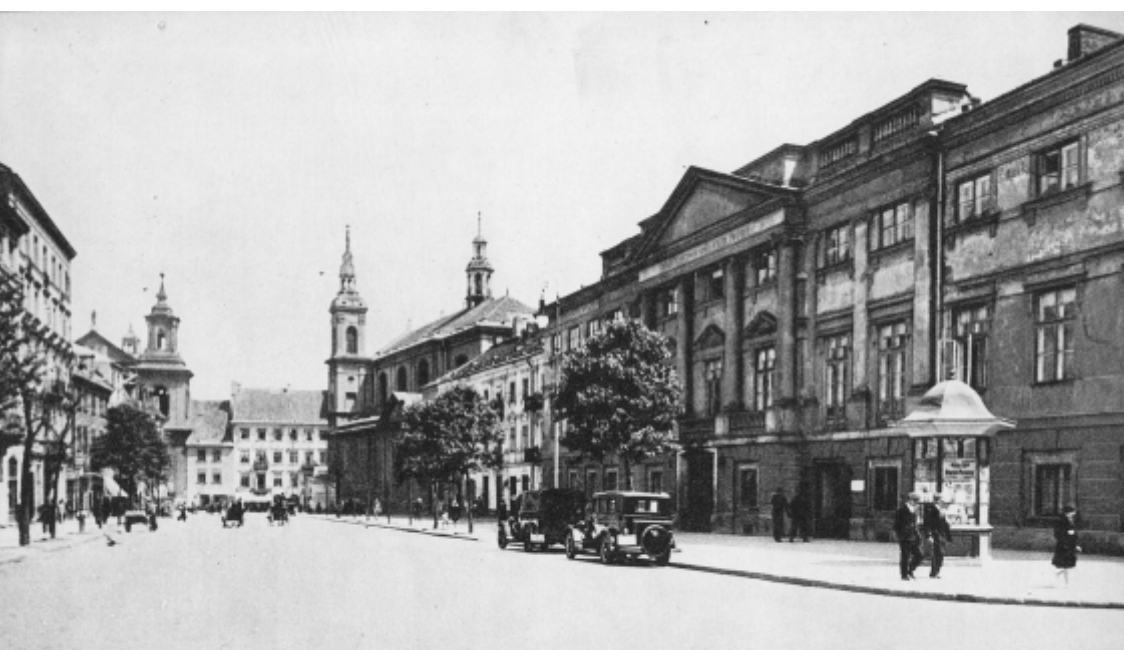
Pałac Raczynskich w Warszawie przed II Wojną Światową. Podczas wojny mieścił się w nim szpital. Jest jednym z wielu Miejsc Pamięci, na którym umieszczono tabliczkę z kodem QR

Materiały te są udostępniane na specjalnie opracowanych tabliczkach, które zostały przekazane do 34 Okręgów ŚZZAK. Następnie są umieszczane we współpracujących szkołach oraz rozsyłane wraz Biuletynem Informacyjnym ŚZZAK do wybranych szkół, Klubów Historycznych im. gen. Stefana Roweckiego „Grot” i Klubów