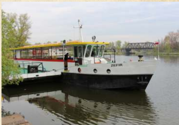
Statek do Serocka oczekujący na Kanale Żerańskim

Całodzienny rejs fragmentem wodnego szlaku Batorego to idealna okazja do zrelaksowania się i odpoczynku. Ze względu na remont śluzy, statek „Zefir” wypływa o godz. 9.30 z przystani na Kanale Żerańskim i płynie w kierunku Zegrza. Jezioro Zegrzyńskie, znajdujące się na terenie Warszawskiego Obszaru Chronionego Krajobrazu Jezioro Zegrzyńskie, to prawdziwy raj dla wędkarzy oraz amatorów sportów wodnych. W tym sezonie statek dodatkowo dopływa aż do zapory w Dębem. Zapora to jedyny zrealizowany obiekt z planowanej kaskady Bugu. W Serocku wycieczkowicze mają około dwugodzinną przerwę na spacer lub odpoczynek na plaży. Rejs kończy się w miejscu rozpoczęcia około godziny 17.45.