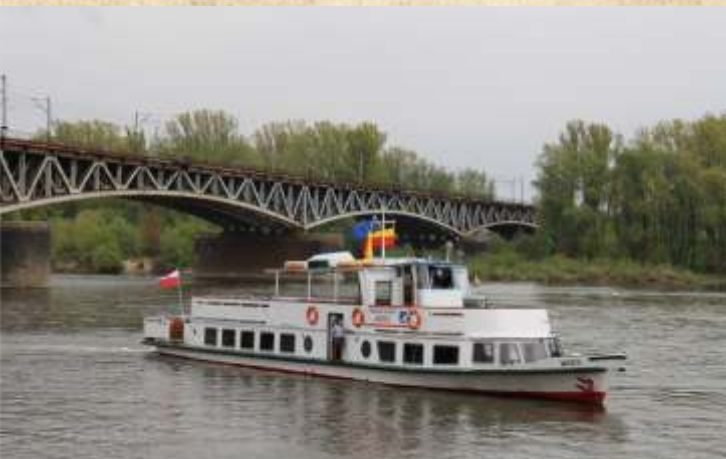
Tramwaj Wodny „Wars” uruchomiony już pod banderą ZTM