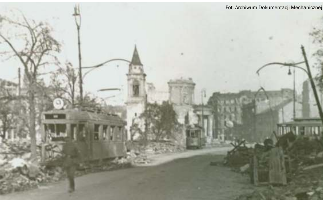
Zniszczone wagony typu H i C na placu Trzech Krzyży. W gruzach doczepa typu P10