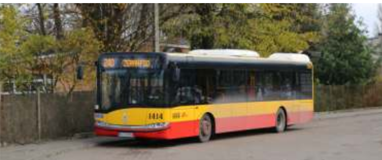
Od listopada ub.r. Marki znajdują się w pierwszej strefie biletowej. Zmieniono także numery linii autobusowych – 240 to dawne 732 obsługujące trasę Żerań FSO – Pustelnik

Latem do autobusów, tramwajów, metra i pociągów dołączyły wodne środki komunikacji – promy, tramwaj wodny i statek do Serocka Warszawskich Linii Turystycznych .