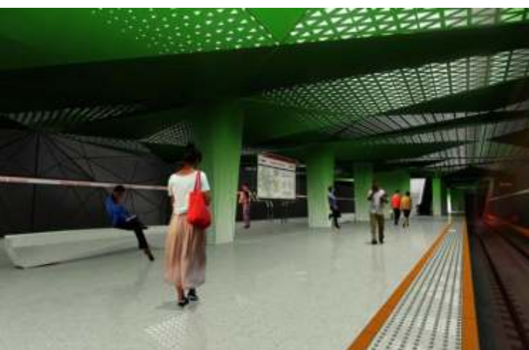
Stacja Księcia Janusza (wizualizacja). Dojazd z ostatniej stacji obecnie budowanego zachodniego odcinka metra do stacji Świętokrzyska zajmie 12 minut

W 2016 roku Warszawa stanęła nie tylko przed dużymi wyzwaniami inwestycyjnymi, ale także organizacyjnymi. W lipcu przez trzy dni w stolicy odbywał się szczyt Organizacji Traktatu Północnoatlantyckiego . Od 7 do 9 lipca część ulic w Warszawie była wyłączona z ruchu, w związku z czym konieczne było kierowanie autobusów i tramwajów na trasy ob-