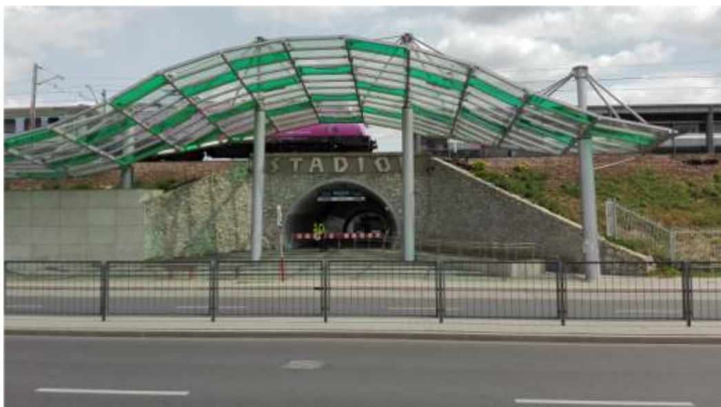
Podczas szczytu NATO pasażerowie nie mogli korzystać ze stacji metra Stadion Narodowy i przystanku kolejowego Warszawa Stadion

1 listopada na ulice wyjechało 1498 autobusów, czyli o 670 więcej niż standardowo w sobotę. 550 kursowało na liniach cmentarnych, a 100 zasililo linie regularne. Najczęściej – co 45 sekund na przystanki podjeżdżały autobusy linii C09 (Metro Młociny – Cm. Północny). Z dwuminutową częstotliwością kursowały linie: C13 (Cm. Bródnowski – Cm. Północny), C27 (Królewska – Cm. Bródnowski), C40 (Metro Młociny – Cm. Północny), C69 (Wiatraczna – Cm. Bródnowski) i C84 (Pl. Narutowicza – Cm. Północny).