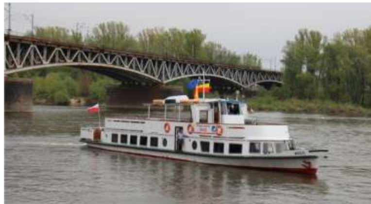
Tramwaj wodny Wars to jedna z atrakcji Warszawskich Linii Turystycznych. W 2016 roku na rejs wybrało się nim ponad 17 tys. osób

Podobnie jak w latach ubiegłych ZTM od maja do września uruchamiały cztery promy łączące brzegi Wisły (Cypel Czerniakowski – Saska Kępa, most Poniatowskiego – Stadion Narodowy, Podzamcze-Fontanny – ZOO, Nowodwory – Łomianki), tramwaj wodny zapewniający półtoragodzinny rejs po Wiśle oraz statek do Serocka.