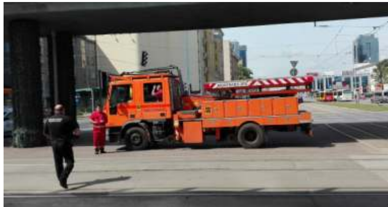
Wóz techniczny Tramwajów Warszawskich przy rondzie Czterdziestolatka. W trakcie szczytu NATO wszystkie miejskie służby pracowały na najwyższych obrotach, aby w nagłych przypadkach interweniować jak najszybciej

Zarząd Transportu Miejskiego uruchomił 29 specjalnych linii cmentarnych – 27 autobusowych i dwie tramwajowe. Autobusowe linie C odjeżd-