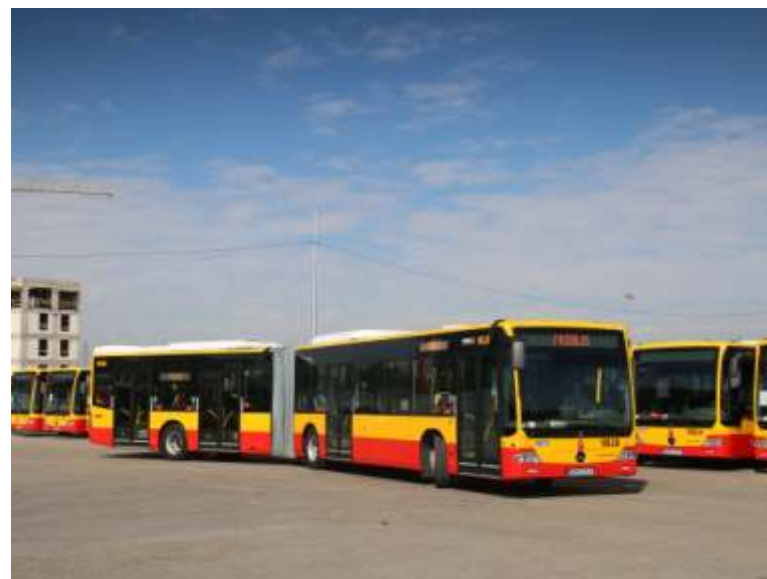
100 nowych autobusów Mobilisu na terenie zmodernizowanej zajezdni w Ursusie na kilka dni przed wyjazdem na stołeczne ulice

Jako pierwszy, według nowych zasad rozpoczął świadczenie usług Mobilis. W sierpniu wyjechał na ulice 100 nowymi autobusami – 50 przegubowymi Mercedesami Conecto i 50 krótkimi Solarisami Alpino. W grudniu dołączyła do niego Arriva z 50 12-metrowymi solarisami.