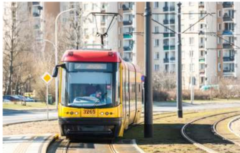
Obecnie do tymczasowej pętli Tarchomin Kościelny dojeżdżają tramwaje linii 2. Po uruchomieniu odcinka do Nowodwórow, jednocześnie planowane jest wydłużenie trasy „dwójki”

krańca Nowodwory. Powstaną dwa zespoły przystankowe – przy skrzyżowaniu ulicy Światowida z Ordonówny i Štefánika. Po zakończeniu inwestycji jeszcze większa liczba mieszkańców Białołęki zyska szybki środek transportu do stacji metra Młociny.