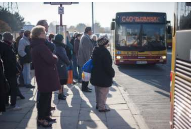
We Wszystkich Świętych ZTM uruchomił 27 autobusowych linii specjalnych. Jedną z najczęściej kursujących linii była C40, która podjeżdżała na przystanki co dwie minuty

Również w styczniu wprowadzono, zapowiadane dużo wcześniej zmiany, które ułatwiają dojazd do pracy na Służewcu . Linię 401, która obsługiwała jedną z najdłuższych tras w Warszawie (Marysin – Ursus Niedźwiadek) podzielono na dwie o krótszych trasach – 401 i 402. Linia 401 od roku kursuje na trasie Ursus Niedźwiadek – Ursynów Płd., a 402 z Marysina do krańca Wynałazek. Na pokrywającym się, najpopularniejszym odcinku trasy, między stacją metra Służew a Służewcem biurowym, obie linie realizują łącznie około 20 kursów, czyli podjeżdżają na przystanki co około trzy minuty. Urucho-