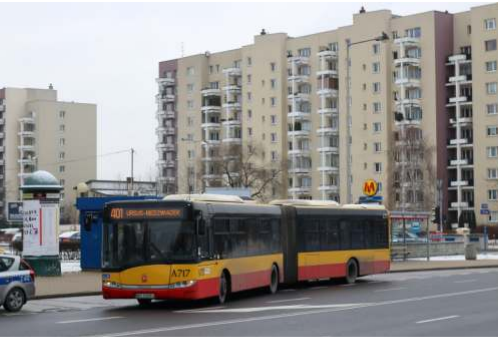
Od stycznia ub.r. osoby pracujące na Służewcu biurowym mają do dyspozycji dwie linie – 401 i 402. Dzięki podziałowi jednej linii o długiej trasie na dwie o krótszych trasach, zyskali linie bardziej punktualne i kursujące częściej na wspólnym odcinku

mienie dwóch, zamiast jednej linii, ale za to na krótszych trasach pozwoliło także na poprawę punktualności autobusów oraz regularności kursów.