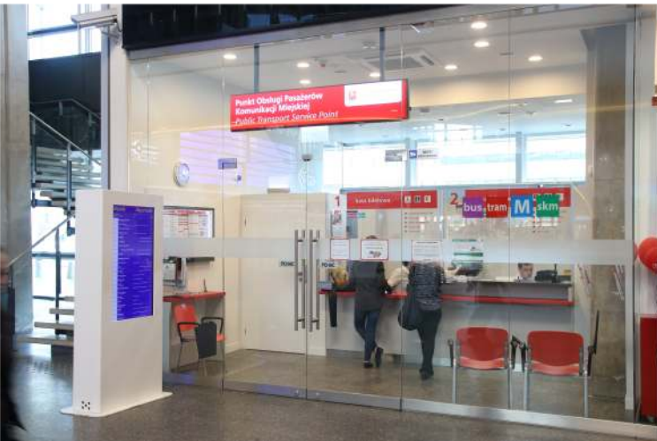
W kwietniu uruchomiono 21. Punkt Obsługi Pasażerów – na Dworcu Centralnym

Zachodni WBK, ING Śląski, mBank, PKO Bank Polski, Orange Finanse, Getin Bank).