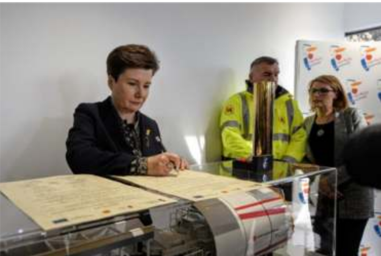
Listopad 2016 roku – podpisanie Aktu Erekcyjnego oraz wmurowanie kamienia węgielnego pod budowę stacji Trocka. Dokument został wmurowany w strop stacji wraz z aktualnymi gazetami i życzeniami od współczesnych dla przyszłych mieszkańców Warszawy

Rozbudowa drugiej linii metra o sześć stacji będzie kosztowała ponad 2,2 mld zł.